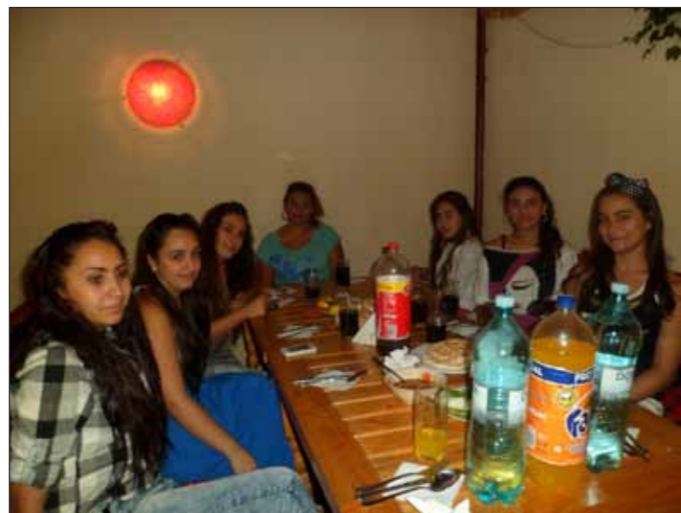
Filiala Județeană Constanța